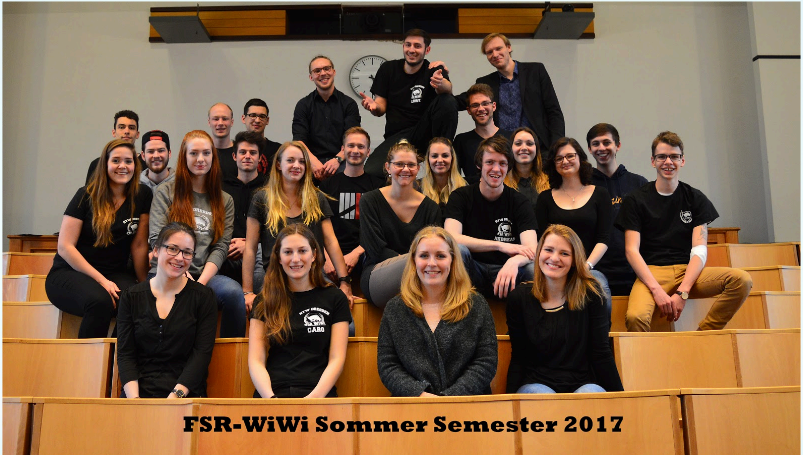
FSR-WiWi Sommer Semester 2017